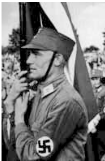
«Гитлер смог, сможем и мы»

Для участвующих в фашистских националистических митингах на сайтах размещаются специальные «кричалки», которые необходимо учить: «Пытать и вешать, вешать и пытать!», «Чемодан, вокзал, Кавказ!» 1 .