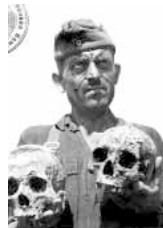
«Тех, кто творчески переосмыслит наследие художника и великого психолога толпы Гитлера, — ждет успех»