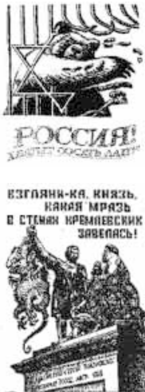
«„Плохие“ народы существуют. Коллективная вина народов существует». Антисемитские листовки с сайта Новосибирского отделения НБП

вел дело до конца» 1 . Семена падают на подготовленную почву. «Мы ненавидим рынки со всеми их бабками и чурками», — вторит фюреру редакция фашистской газеты «Инкуб» 2 .