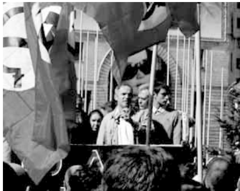
Каспаров под фашистскими знаменами

Присоединился к НБП и Каспаров, настойчиво рекламирующий себя как активного деятеля оппозиции. В одном из своих авторских материалов, размещенных на сайте Объединенного