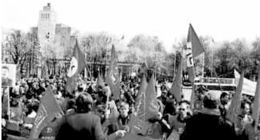
«С центральным руководством КПРФ сложились нормальные, рабочие отношения». Совместный митинг КПРФ и НБП

началось активное объединение либералов с фашистами, а фашистов — с «врагами народа» и «подлецами» в «одну кофлу».