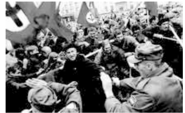
Мирное, ненасильственное побоище

Даже к одежде у нацболов главное требование — удобство в драке: «Ботинки должны быть удобными и мощными, это оружие в уличной драке. Вся одежда должна быть удобной, свободной и практичной. Подбирай одежду по принципу того, что в драке доставит тебе наименьшее количество неудобств и сюрпризов. „Если голова обрита — не схватишь за волосы, у бомбера нет воротника, и он не сковывает движений, джинсы прочны и не марки, берцы — хорошая фиксация и максимальный урон врагу“. Примерно таким должно быть мышление партийца» 4 . Примечательно, что все эти требования полностью совпадают с требованиями, которые предъявляют к своей одежде скинхеды. Также «нацболы любят оружие. Часто они носят с собой ножи, кастеты, отвертки или похожие на настоящие