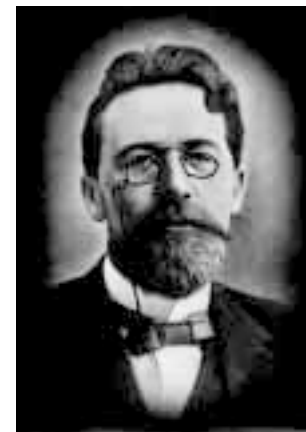
«Чехов — это извращение»

Спать на х... вишневый сад и уехать в Москву первым же поездом. Зонтики, кружева, едкий запах подмышек и тела никем не используемых по назначению (ибо Чехов — чахоточный больной) трех сестер. Ведь Чехов — это извращение 1 .