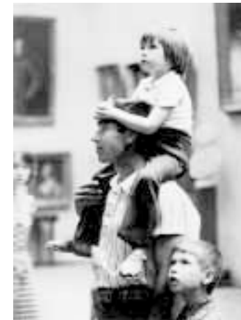
«Семья, сучий потрох, гнойный аппендицит, группа тел...»