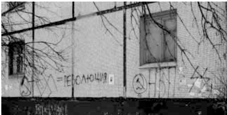
НБП метит территорию. Стена дома в г. Калуге

токолы сионских мудрецов» 1 — фальшивка, сляпанная в недрах царской охраны в начале XX века, в которой во всех бедах обвиняется «мировое еврейское правительство».