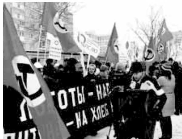
«Мы не собираемся отказываться от совместного участия наших сторонников в конституционных демонстрациях протеста»

мучеников режима — молодых лимоновцев, томящихся в тюрьмах... Эти молодые люди — сегодня совесть России» 1 .