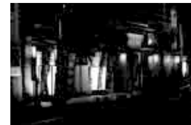
«Только в коммуне, свободном общежитии мужчин и женщин, возможно свободное равенство»