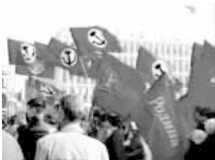
«Мы готовы сотрудничать с любой оппозицией»