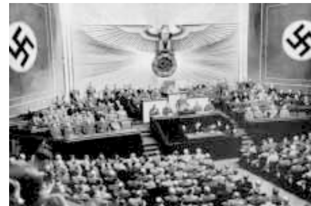
«Обыватель грезит отдать в фашисты сына и выдать за фашиста дочь»

Нельзя забывать и о том, что в стране, имеющей уникальный опыт многовекового сосуществования десятков народов и наций, фашизм — это гибель страны. Ведь фашистами предлагают стать русским и, в свою очередь, относиться ко всем остальным как к недочеловекам. Как только начнется война против тех, кто кричит носом и чер-