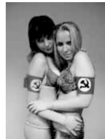
«Я ценил их вульгарность».

...но он их разрешает, опираясь на уже знакомые исторические примеры.