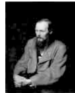
«Достоевского лучше читать в изложении, чередующемся с хрестоматийными отрывками»