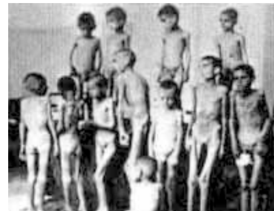
«Дети будут с обожанием бегать за колоннами фашистов»

Кому необходим сейчас фашизм в России? Ответ может показаться странным: всем. Бесчувственным, реагирующим только на супершоковые, особо кровавые и особо жестокие события российским гражданам на самом деле хочется, чтобы пришли фашисты. Они — страшные, подтянутые, молодые, они решили бы все вопросы. Обывателю хочется, чтобы (ну да — он боится их и голосует еще против них, но во сне видит их, желанных) фашисты пришли наконец и навели порядок. Чтобы браваурная героическая музыка и яркие флаги разбудили обывательский сон. Обыватель грезит отдать в фашисты сына и выдать за фашиста дочь... Дети будут с обожанием бегать за колоннами фашистов, наконец им будет кем восхищаться: не рахиты Микки, не Бэтмены и слизь из загробного мира, но бравые парни русских городов, живые герои... Запад зайдется в