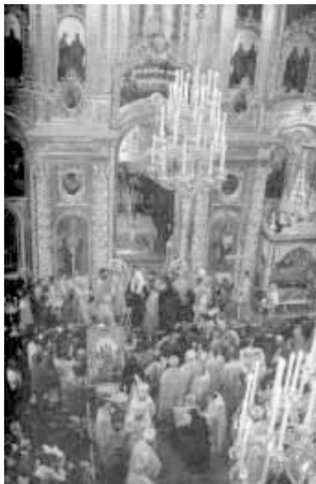
«Жирная челядь делает пассы»

сама консервативная реакционность их взглядов выбрала им в партнеры православную церковь. Но хитрая толстая старуха РПЦ избрала в партнеры Власть. А радикальным партиям даже не кивнула за десять лет. Можно сказать, что это крайне глупая политика — клясться в верности толстой старухе, которая вас, ребята, не хочет 1 .