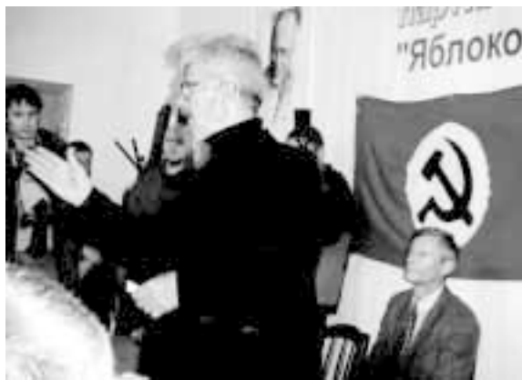
Фюрер в офисе питерского «Яблока» под фашистским флагом... и портретом Сахарова