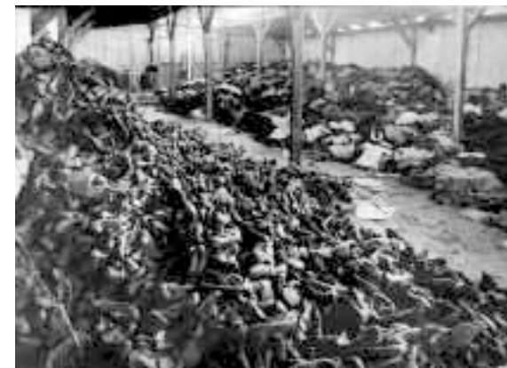
«Хочется, чтобы пришли фашисты. Они решили бы все вопросы»

Через несколько лет «партстроительства» Лимонов отмечает, что цель отчасти достигнута: «Глядя на наши региональные отделения Национал-большевистской партии, мы с удовлетворением замечаем, что их возглавляют поэты, рокеры, психопаты, панки, недоучившиеся студенты» 5 . Один из основателей НБП Дугин исчерпывающе охарактеризовал членов «партии» в своей статье в «Лимонке» как «попивающих пиво, играющих в шахматы, боксирующих обитателей Бункера, бесполезных полудурков, которые еще к тому же и не прочь взять то, что плохо лежит» 6 .