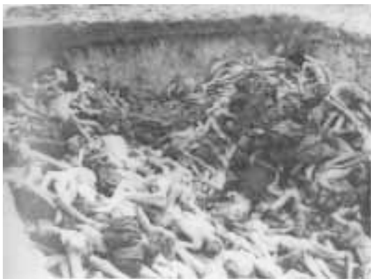
«Без фашистов скучно. Не проживем»

экстазе, если в России восторжествует суровый и красивый молодой строй — хищный зверь без лишних мышц. Фашизм устраивает всех. Аскетизм чувств, насильственно предписанный в демократии массам, сменится разгулом чувств при фашизме, и все будут ходить как пьяные от этой новой свободы. Наконец исчезнет из словарей скучное слово «экономика», и популярным станет чувственное «трибунал». Всем будет хорошо. В истеричной периодичности вспыхивающих время от времени в нашем обществе попыток выявить, запретить, задавить фашизм чувствуется инстинктивное понимание того, что фашизм — главный враг всех политических сил, изображающих сегодня «политику» на российской сцене. Никто не знает, где именно этот дикий юный зверь, в кого он перевоплотился сегодня, но его молодой и сильный животный запах присутствует в России, и домашние животные нашей политики режут и плачут в ужасе, пред-