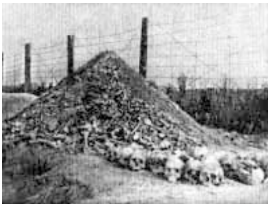
«Фашизм устраивает всех»