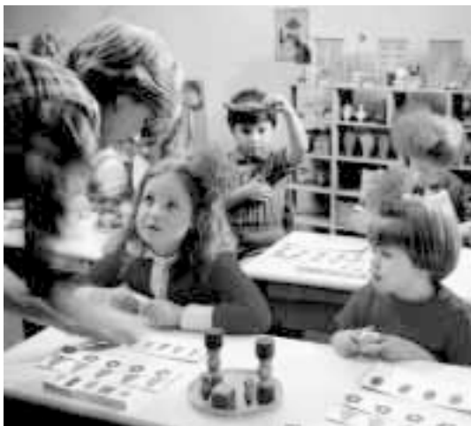
«Школа должна быть поставлена в один ряд перед тюрьмой»

...школа задумана как репрессивное учреждение. Она должна быть поставлена в один ряд, через запятую, перед тюрьмой 1 .