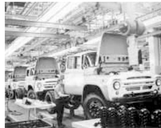
«Вся гнусность и подлость — вот эти заводы, фабрики»

Если наши идеологические враги проповедуют производительность труда, то глупо проповедовать еще большую производительность труда. К тому же доподлинно зная, что у них лучше получается с механическим трудом и производительностью. Надо проповедовать нечто иное, совсем-совсем иное. Братство людей, свободу человека от механического труда. Сексуальную комфортность. Право на войну 1 .