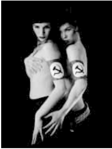
«Бледные барышни с лунными ляжками, светящимися в темноте! Сколько я вас познал!..»

недооценивать революционность стремления человека к сексуальной комфортности. Она важнее права на труд. За сексуальной комфортностью шли в семью к Мэнсону 1 его девочки. И он привязал их на десятилетия. Работал Мэнсон просто — употреблял секс-терапию. Сексуальный акт служил высшей формой ласки, служил для снятия напряжения и одновременно спаивал коллектив коммуны самыми прочными узлами. Мужчин в коммуне Мэнсона было намного меньше, чем девушек, где-то в пропорции 1 к 5 или 1 к 3. Вульгарное воображение называет подобные отношения „свальным грехом“ или „оргиями“, на самом деле, когда через месяц или два спадает ощущение новизны и необычности происходящего, видны становятся огромные преимущества подобного существо-