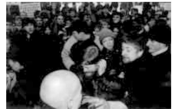
«Круг мгновенно замкнулся, и дугинцев начали валить». Драка, устроенная нацболами на акции у Министерства обороны 23.02.2006