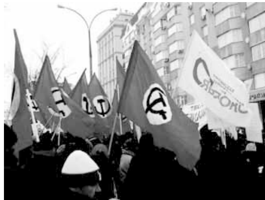
«С нацболами мы будем проводить совместные акции, направленные на борьбу с властным режимом»