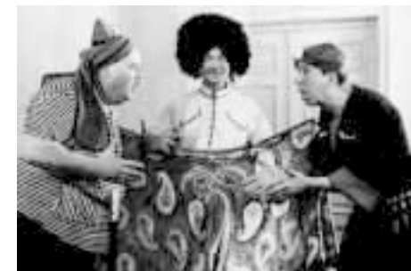
«Дегенераты», или «тройка уродов»

В 1956 г. на экраны вышел фильм «Карнавальная ночь». Сейчас его называют шедевром, но фильм, по сути дела, ничтожен. После «Карнавальной ночи» — «Бриллиантовая рука», «Берегись автомобиля!» и многие десятки им подобных кинокомедий воспитали несколько поколений обывателей. Вицин-Моргунов-Никулин отплевывали свои пошлые чечетки на всю страну. Мелкие проблемы, мелкие заботы, гримасы, ужимки 2 .