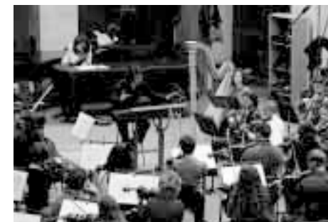
«Я бы вырезал всех виолончелистов и скрипачей»

Я ненавижу симфонические оркестры, балет, я бы вырезал всех виолончелистов и скрипачей, если б когда пришел к власти 4 .