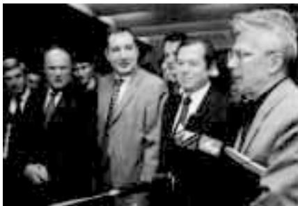
«Мы не отказываемся от сотрудничества ни с кем»