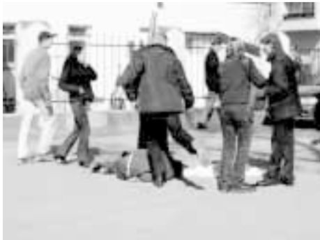
«Да мы булавкой никого не укололи». Избиение лимоновскими фашистами 14-летнего подростка у здания Таганского суда в Москве. 13 апреля 2006 г.