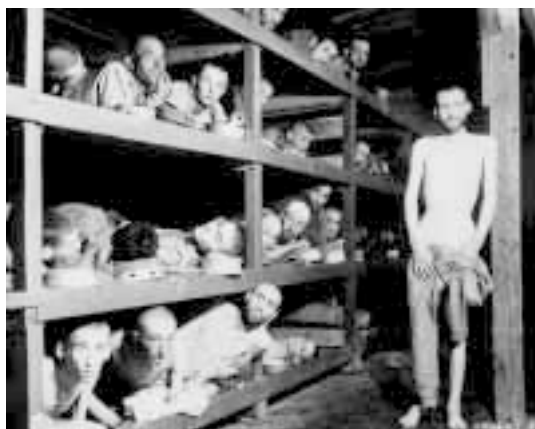
«И будет много детей, силы и счастья в доме»

дающийся не по наследству вместе с аристократической кровью, но идеал рыцарства. Агрессивность, правдивость, правота, верность, вера, внутреннее мужество, чувство истины (не диктуемое обществом), честь, стыд, владение собой, дисциплина, ответственность, последовательность, единство фразы и действия, преданность и постоянство, благородство и, наконец, готовность жертвовать жизнью ради Формы, Порядка, Строя — вот добродетели фашиста, составляющие кодекс духовной мужественности 1 .