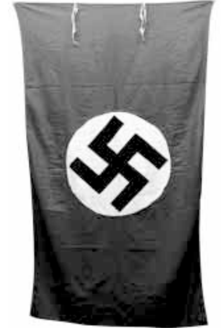
Флаг германских фашистов

«Это самый могучий аккорд красок, который вообще возможен»