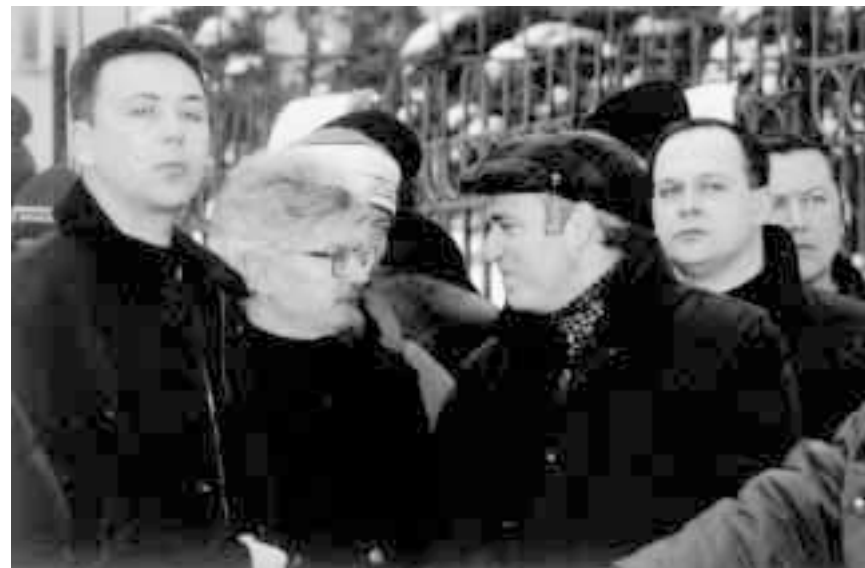
Каспаров и Лимонов на акции у Министерства обороны 23.02.2006

Примечательно, что как сам фюрер Лимонов, так и его соратники ради объединения поступаться своими фашистскими принципами не собираются, о чем говорят открыто, и так же открыто дают отпор всем союзникам, кто пытается указать им на фашизм и национализм. Когда Явлинский осторожно призвал Лимонова «прекратить неадекватный ситуации эпатаж и отмежеваться от национал-большевизма» 1 , то как лидер «Яблока», так и другие союзники немедленно получили ответ, не оставляющий никаких сомнений в том, что отказа от «идеалов» фашизма не будет. «Это идеал, за который заплачено кровью, и отречься от него по прихоти вышедших в тираж политиканов, кухонных трибунов и диванных революционеров мы не станем. Помощь примем с благодарностью, независимо от того, кто бы ее ни предложил». Заканчивается отповедь союзникам красноречивым: «Советчиков — на х...» 2 Это означает только одно: ради союза отказываться от «идеалов» придется СПС, «Яблоку»,