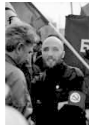
«Эти молодые люди — сегодня совесть России»