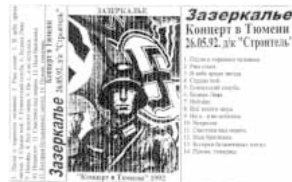
Такую музыкальную рекламу лимоновские фашисты размещают на сайте НБ-арт

в осуществлении любой революции многозначительную роль играет музыка восставших. В этом деле необходима вдохновляющая музыка, слушая которую хотелось бы поскорее осуществить свержение врагов и построение своего прекрасного строя. За образцы такой музыки целесообразно взять некоторые советские марши и мотивы немецких. И, без-